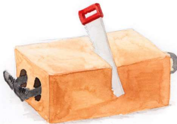
ILLUSTRATION ©TRÂN TRAN