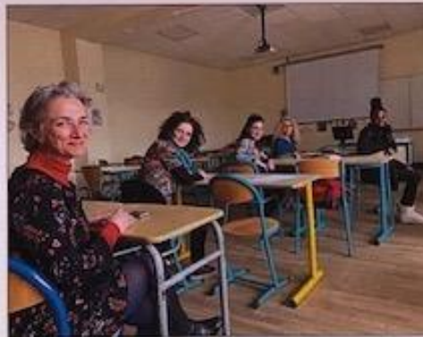
Une collaboration entre l'espace Koitès et Cap étoile a permis à la pièce d'être jouée à Metz, ce lundi 22 mars.

En ces lieux, durant une heure, une comédienne, une metteuse en scène et une cinéaste, toutes membres de la coopérative artistique parisienne Cap étoile, ont offert la