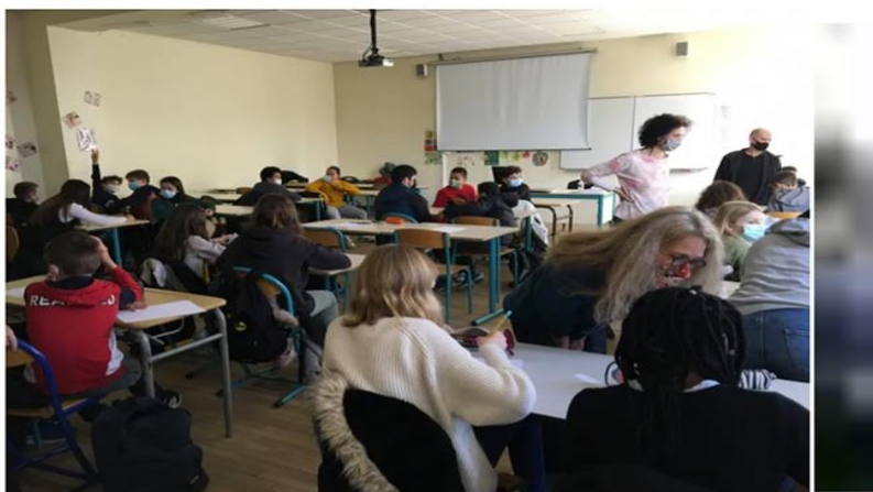
Après la représentation, un temps de dialogue a été ouvert entre les artistes et les élèves