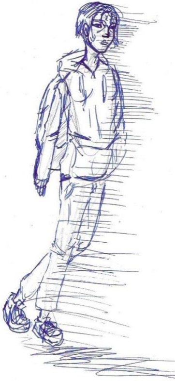
dessin d'un élève de 3 ème du collège Gambetta

j'ai fait ça à quelqu'un et vous ne pourrez pas l'éviter."