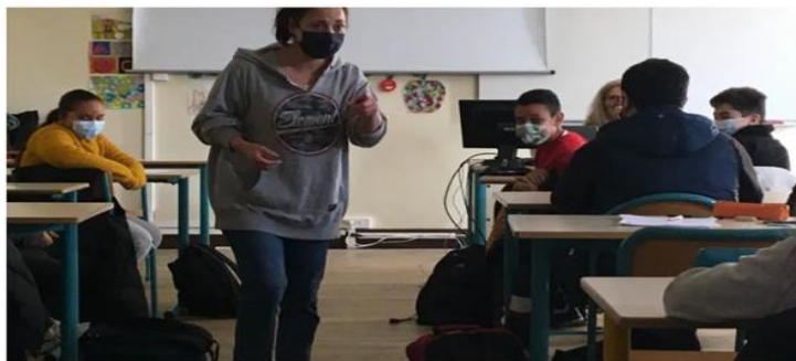
Le harcèlement scolaire évoqué dans une pièce de théâtre face aux élèves de 6ème du collège Georges de la Tour à Metz

Comment aborder le plus sereinement possible un sujet aussi douloureux que le harcèlement scolaire ? Les élèves de 6ème du collège Georges de la Tour, à Metz, ont pu le faire grâce à une pièce de théâtre. Certains connaissaient déjà le sujet : le harcèlement peut commencer dès l'école primaire.